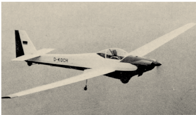
Die SF-33 mit ihrer ersten Kennung „D-KOCH“

Der Markt forderte einen unkomplizierten, einfach zu handhabenden, für den Vereinsbetrieb tauglichen, einsitzigen Motorsegler. Nachdem die Verhandlungen der Firma Scheibe mit BMW zum Einbau eines BMW-Triebwerks in einen Scheibe Motorsegler erfolgreich waren, wurde das Projekt SF-29 wiederbelebt und die SF-29 kurzerhand firmenintern in SF-33 „Trainer“, umbenannt. Man wollte zunächst keine Neuanschaffung zur Musterzulassung beim Luftfahrt-Bundesamt. So erhielt die „neue SF-33“ die Kennung der SF-29 D-KOCH. Auch die Werk- und die Geräte-Nummer der SF-29 wurden für die SF-33 übernommen.