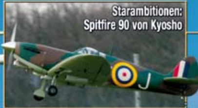
Starambitionen: Spitfire 90 von Kyosho