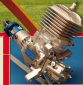
Kraftpaket: MVVS 50 Benzinmotor

wellhausen & marquardt Mediengesellschaft