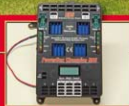
Sicher ist sicher: Champion von PowerBox