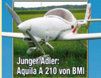
Junger Adler: Aquila A 210 von BMI