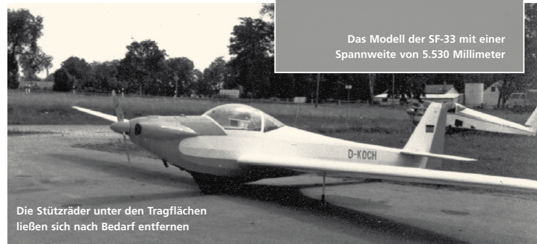
Die Stützräder unter den Tragflächen ließen sich nach Bedarf entfernen