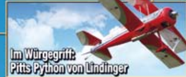
Im Würgegriff: Pifis Python von Lindinger

Alles über Motorsegler Grundlagen • Typen • Modelle •