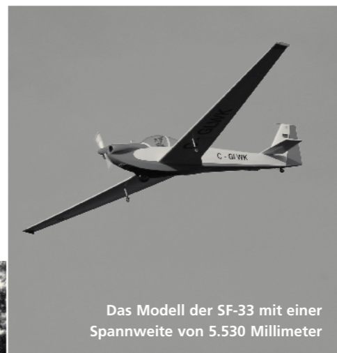
Das Modell der SF-33 mit einer Spannweite von 5.530 Millimeter