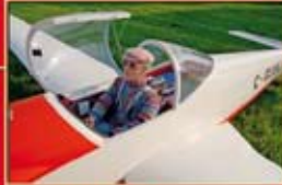
In memoriam: SF-33 Scale-Nachbau

D: € 12,00 A: € 13,20 CH: sFr 23,50 L: € 13,80 NL: € 13,80 DK: dKr 122,00 F: € 16,00 I: € 14,80